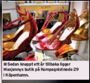
■ Sedan knappt ett år tillbaka ligger Maxjennys butik på Kompagnisträde 29 i Köpenhamn.