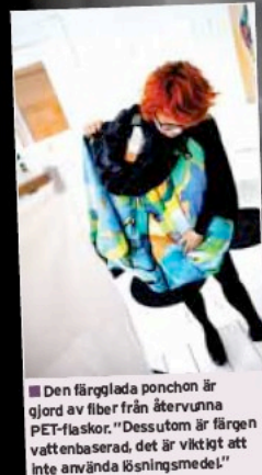
■ Den färgglada ponchon är gjord av fiber från återvunna PET-flaskor. "Dessutom är färgen vattenbaserad, det är viktigt att inte använda lösningsmedel."