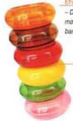
GENBRUG – Plastikarmbåndene har min far skabt i 70'erne. Jeg har nu købt hans forme og genskabt dem.